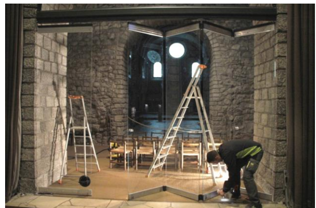
Les 4 panneaux mobiles

L'entreprise REV'ALU commence l'installation de la verrière sous l'arche entre le clocher et l'église des séculiers, en remplacement du rideau. La première tranche consiste à fixer une armature sous la voûte et d'une poutre transversale. La pose d'une porte et des 4 panneaux mobiles se fera la semaine suivante.