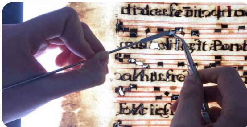
Restauration de l'hymnaire cistercien de 1635 par Clair Engelhorn

La numérisation des manuscrits anciens de l'abbaye de Tamié effectuée par les soins des Archives départementales de la Savoie sont mis en ligne à mesure qu'ils seront disponibles.