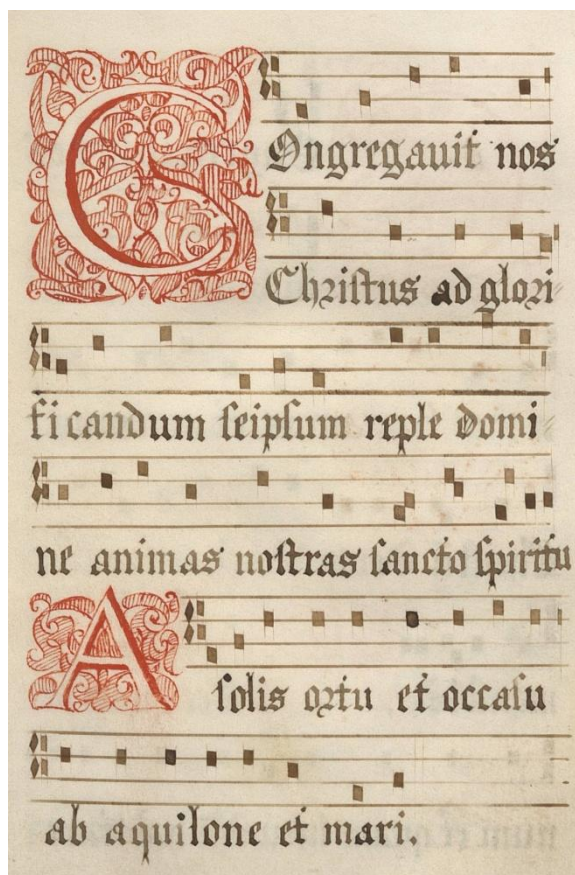
Manuscrits de l'abbaye de Tamié

Inventaire général de tous les titres - 1659