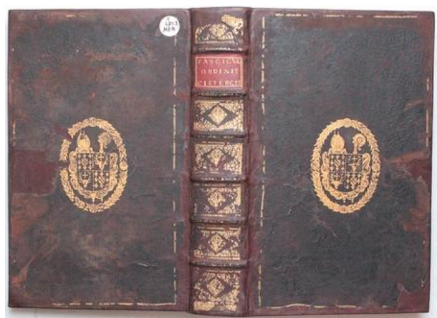
Avant et après restauration

Notre Frère archiviste dépose aux Archives départementales de la Savoie, trois autres manuscrits restaurés à numériser par les services départementaux : Ms 14 : Liber celebrii monasterii van Nonnenbosch du 16ème siècle, Ms 30 Ordinarium Cisterciense du 14ème siècle sur papier, Ms 48, Hymnaire cistercien de 1635 sur papier, restauré par les soins de Claire Angelhorn.