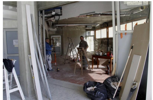
Aménagement d'une salle de conférence