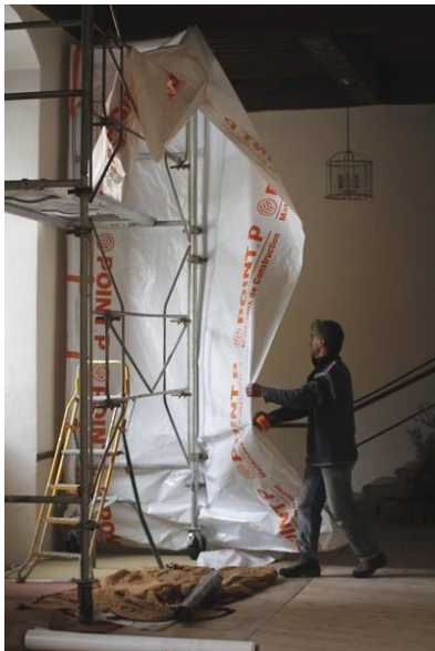
Protection contre la poussière