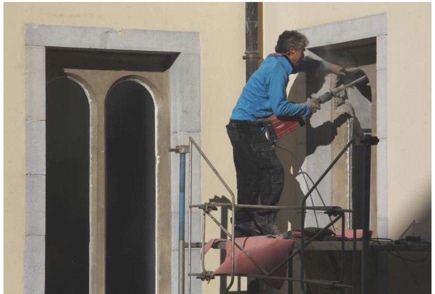
Dépose de la structure en béton datant de 1930