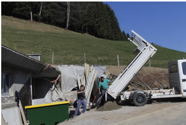
Ouverture d'une nouvelle porte

Lundi 10 : Au Centre d'accueil une nouvelle porte est ouverte côté ,nord en creusant le talus pour donner accès à la salle de réunion qui sera aménagée à la place de l'ancienne réserve du magasin et de la chambre froide.