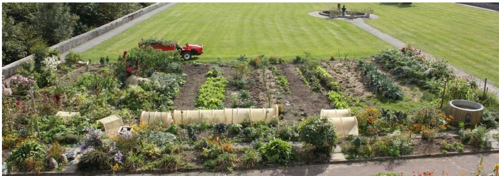
La végétation luxuriante une fois dégagée laisse apparaître les plates-bandes de légumes

Père abbé part pour Aiguebelle participer au G9 (groupe informel de 9 supérieur(e)s de communautés monastiques proches) pendant 2 jours à échanger sur le thème : discernement des vocations, des failles psychologiques, comment faire face aux erreurs commises. Comment gérer les personnes qui ne sont pas heureuses et ne rendent pas les autres heureuses. Comment rejoindre ceux ou celles qui ne veulent pas être rencontrés ?